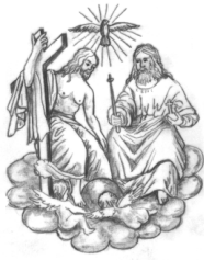
Hl. Dreifaltigkeit Ränkam