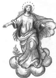
Mariä Himmelfahrt Furth im Wald